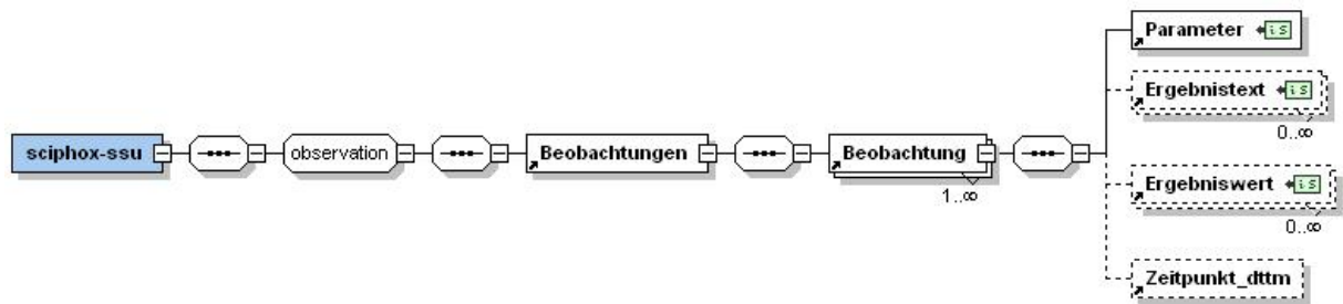
Abbildung 4 – allgemeiner Aufbau Sciphox-SSU observation

Der XML-Code zum Element sciphox-ssu sieht folgendermaßen aus: